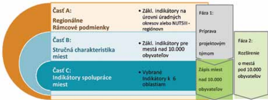
Obrázok 1 Prehľad budovania TwinRegion-Scorecard